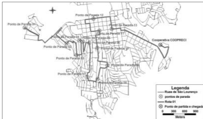
Fig. 1 Rota de segunda, quarta e sexta-feira (Rota 01)

Com o acompanhamento do caminhão durante uma semana foi possível realizar o mapeamento das duas rotas que estavam sendo realizadas pelo caminhão, a Rota 01, que se repetia na segunda, quarta e sexta-feira e a Rota 02 que se repetia na terça e quinta-feira. Para realizar o mapeamento foi utilizado um aparelho GPS portátil, armazenando os dados relacionados às duas rotas, tais como velocidade média, tempo total decorrido, pontos de paradas, entre outros. Em seguida, esses dados foram transferidos para o software TransCAD (versão acadêmica 6.0) utilizando o software MapSource para a conversão das informações geográficas. As Rotas 01 e 02 são apresentadas na Figura 1 e 2, respectivamente. Ambas as rotas começam e terminam na cooperativa COOPRECI. As características das duas rotas são apresentadas na Tabela 1.