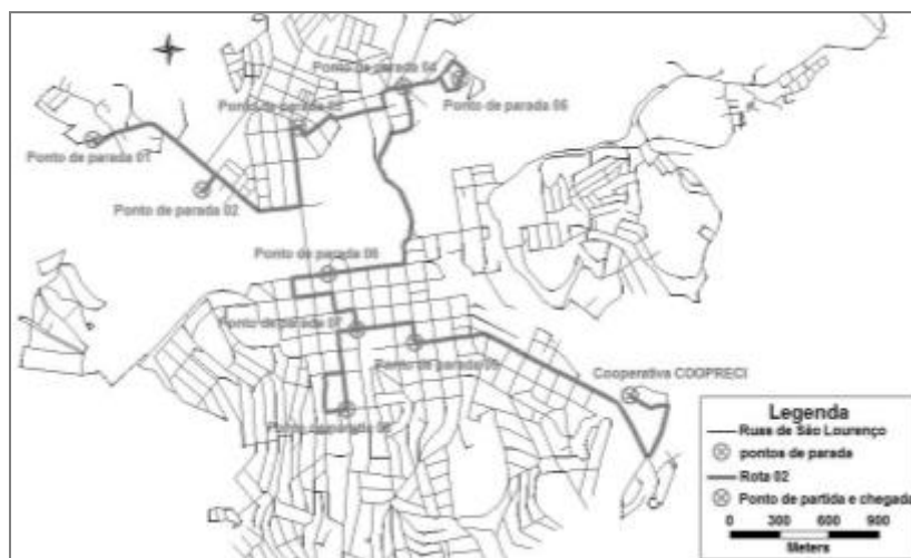
Fig. 2 Rota de terça e quinta-feira (Rota 02)